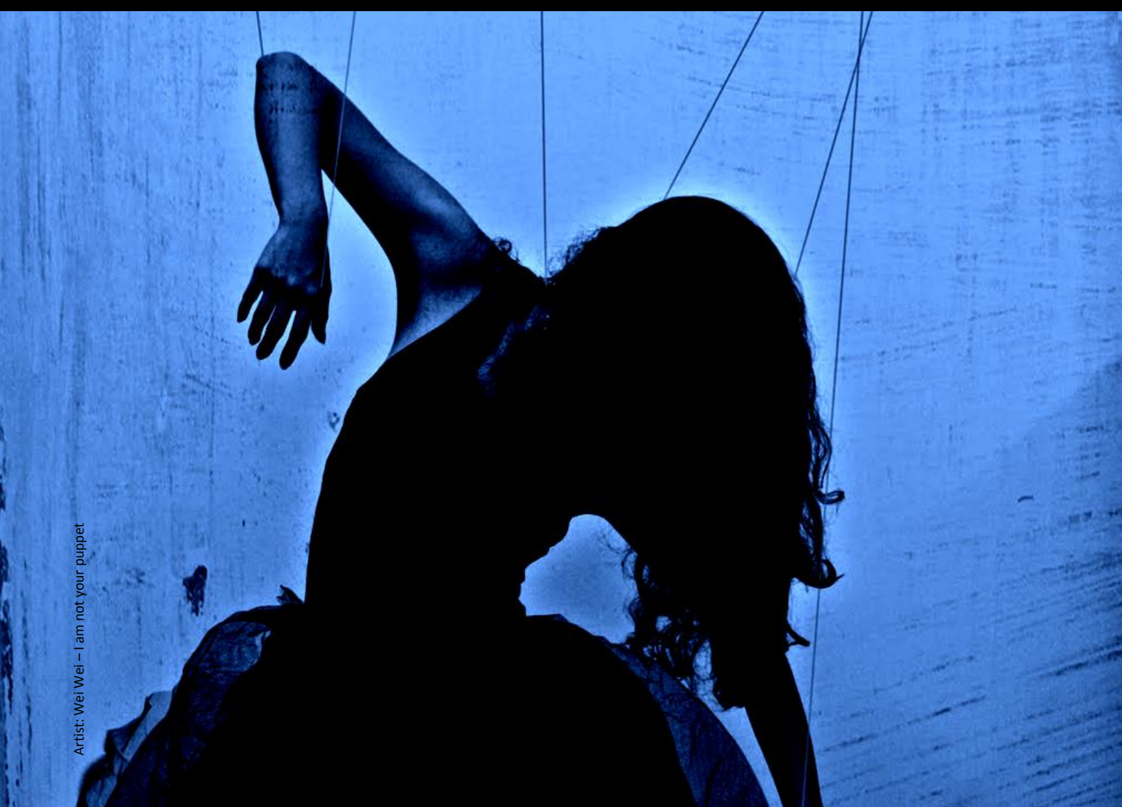
Artist: Wei Wei – I am not your puppet

22 Veerkracht door... beweging Over beweging & herstel van trauma